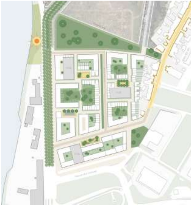
Eerste proefverkaveling zuidelijk plandeel