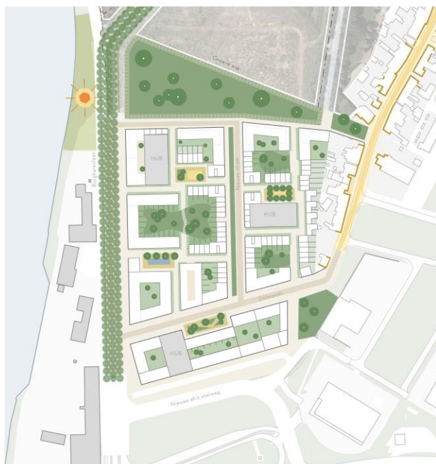
Eerste proefverkeveling zuidelijk plandeel