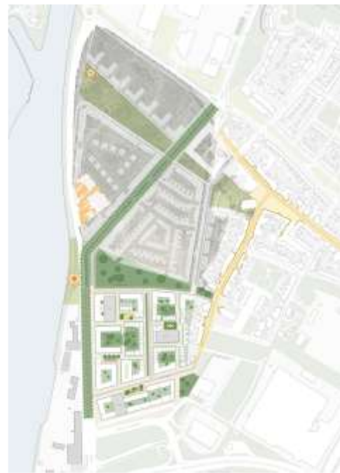
breder context totaal plangebied