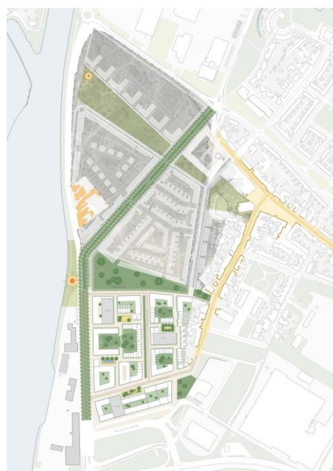
breder context totaal plangebied